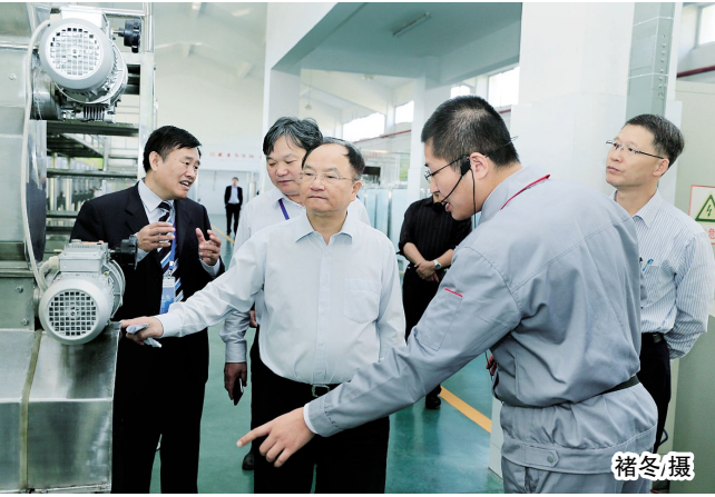
专家组在我院领导的陪同下,先后来到实训室、食品药品分析检测中心等,对我院“骨干校”重点建设项目经费使用情况,以及设备使用绩效等进行了现场检查。

10月9日,江苏省教育厅组织的专家组抵我院。他们分别是:上海教科院副院长、专家组组长马树超,常州大学党委书记史国栋、上海第二工业大学陈解放,浙江金融职业技术学院党委书记周建松,无锡职业技术学院原院长戴勇,常州工程职业技术学院党委书记袁洪志,苏州农业职业技术学院院长李振刚。江苏省教育厅副厅长、党组副书记丁晓昌,淮安市副市长王红红以及省厅高教处处长袁菁