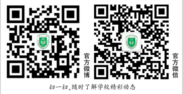
扫一扫,随时了解学校精彩动态