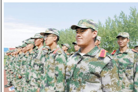
军训是大学的第一节课,立正、跨立、正步走……炎炎烈日下,2019级新生身穿迷彩服,按照教官指令,一招一式反复练习动作要领。