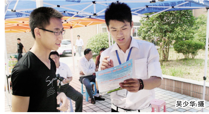
财贸学院市场营销专业是国家骨干校建设专业。在建设过程中,他们不断强化校企合作,组织学生开展社会实践服务。该院与淮安“快鹿牛奶”签订了合作协议,成为“快鹿”公司的销售代理。图为营销专业学生在向顾客推销“快鹿”牛奶。

素及其他细节等方面进行了论述,特别强调了微课设计中的选题、教案设计、PPT设计、讲解设计、肢体语言和板书等要素。马涛结合自身体会,并以获奖的作品为例讲解具体,形象生动,赢得了大家的一致认可。(教务处;田其英)