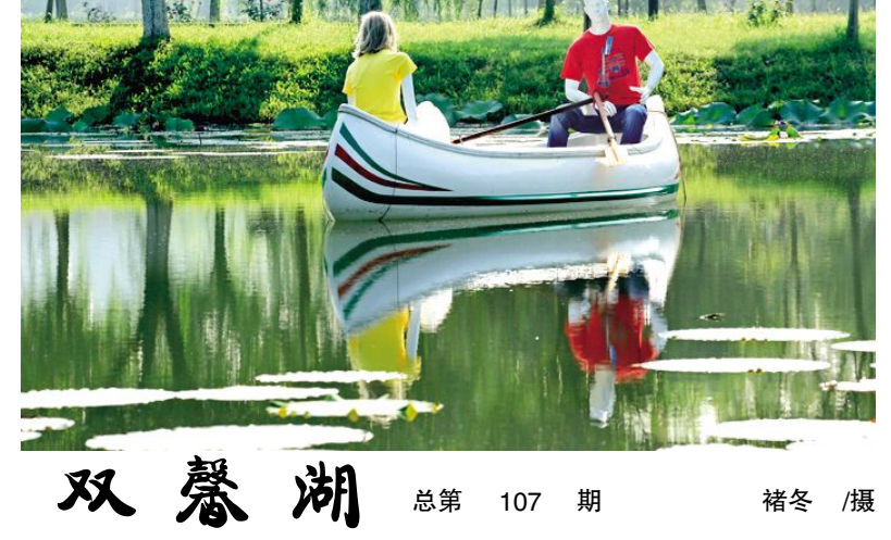
双馨湖 总第 107 期

喜以校为邻,总觉得校园是有节奏的,闹与静,张与弛,自然而得当。一到寒暑假,学子如劳燕归巢,整个校园还回了一片片恬淡宁静。偌大的校园犹如经历大赛后的休憩,恬静谧雅,中学、大学校园里的林荫下、斜阳里、