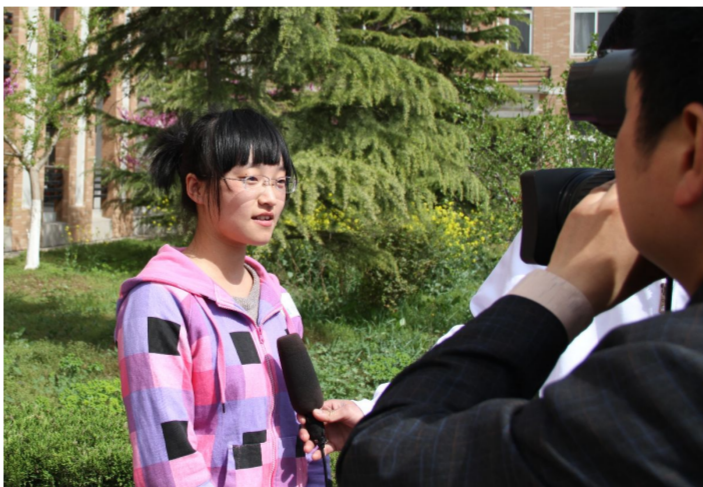
面试考生欣然接受淮安市电视台采访