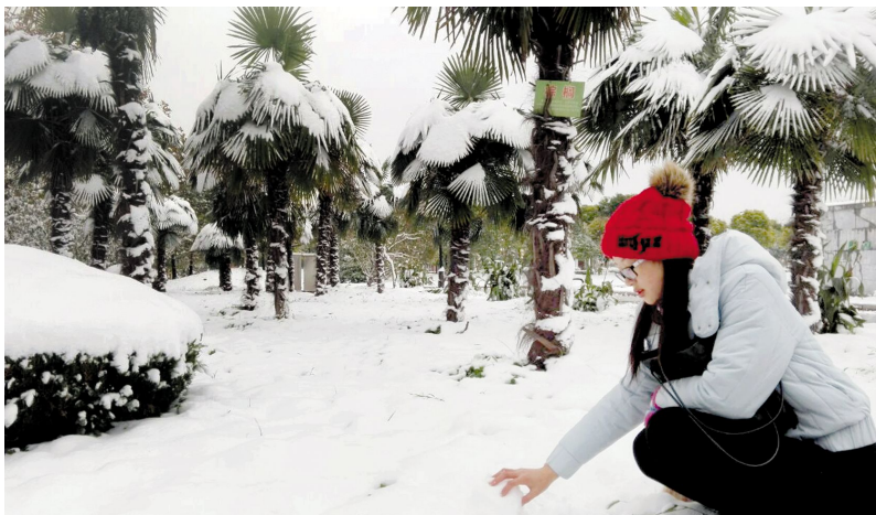
双馨湖 总第126期