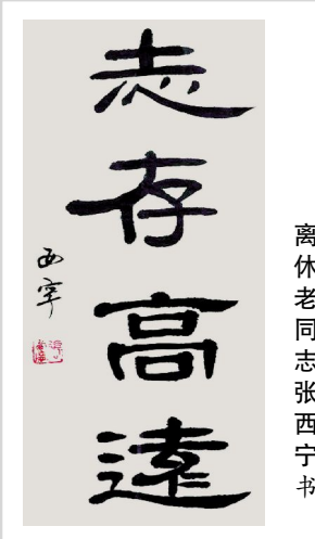
退休老同志 张西宁 书