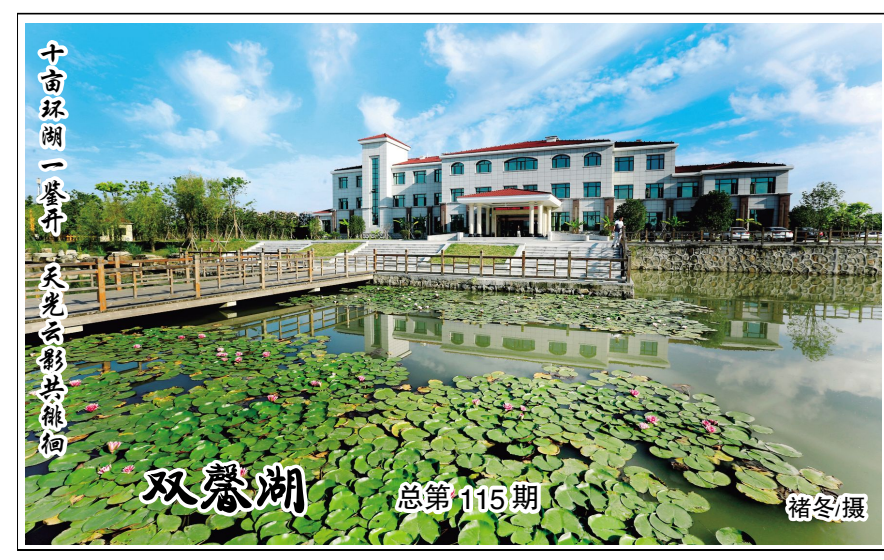
十亩环湖一翠芦 天光云影共徘徊 双馨湖 总第115期

假日随笔 夏天的阳光总是来的比其它季节要早。早间睁开双眼,夜雨初停,厚重的窗帘将所有阳光阻挡在外面,却抵挡不住生生不息的蝉鸣。 原本以为这个夏天会有各种各样的聚会,就像电影中主角分别时的场景。大排档里围坐一圈,胡吹海吃,畅想未来。可现实却是大部分时间都在家里,没事聊着朋友圈,默默点赞。 单招让我的假期变得格外漫长,家里托关系给我找了我在人生中的第一份工作,在一家男装店里做兼职销售员。 第一眼见到老板娘,她笑容满面,可我总是觉得那副笑容下有着商人独有的市侩。顺利通过后,老板娘将我带到了店里,简单告诉我店里的情况,第二天便正式上班。上班后才发现店里就我一人,顿时有点手足无措。后来才知道老板娘为了减少人员开支,辞退了原来的销售员,给我的工资也是原来销售的一半,自然这是后话。不过好似像我们这个年纪的人总有一份闯劲,我一个人也独自担起了整家店的销售工作。每天看着不同人进出店里,都是问多买少。 其实男人并没有想象中那么豁达与大方,他们也很斤斤计较。用南京话讲就是“夹生”,时常因为价格最后无疾而终。我们店铺做的是周边大学生生意,暑假临近,店里鲜少来人,自己也倒落的轻松。于是打算与周边商户闲聊,结果发现大家聊的都是炒股、基金之类的话题,插不上话的我也就过去打搅,自己独自一人看店。一种莫名的情愫在心中滋生,最后当他们一家接着一家关门歇业,人越来越少的时侯,那种情绪陡然爆发。铺天盖地的将我整个掩埋,我越觉得现在的工作是在消磨生命。直至发工资的那天才“活过来”。我记得那一天下班后的早,那时的天空很蓝,简直是蓝的不可思议。 这是我假期的第一份,也是最后一份工作。暑假找兼职的难度不比高考考,甚至比高考更可怕。毕竟那6张白纸,不会对你阳奉阴违。工作本身也比写试卷辛苦的多。当大多数事情总是事与愿违,四处碰壁后,在父母的劝说下,我放弃了再找一份工作的想法。 其实我知道我现在遇到的阻碍和我以后遇到的事情相比,简直有着云泥之别,但是我们还很年轻啊,正是这些磨难,才能使我们的的人生更加完整。 最近几周天津的大爆炸闹得沸沸扬扬,在灾难面前,人显得格外渺小。突然间发现,只要身边家人和朋友平安,比什么都重要。(养松 156 龚张天婷)